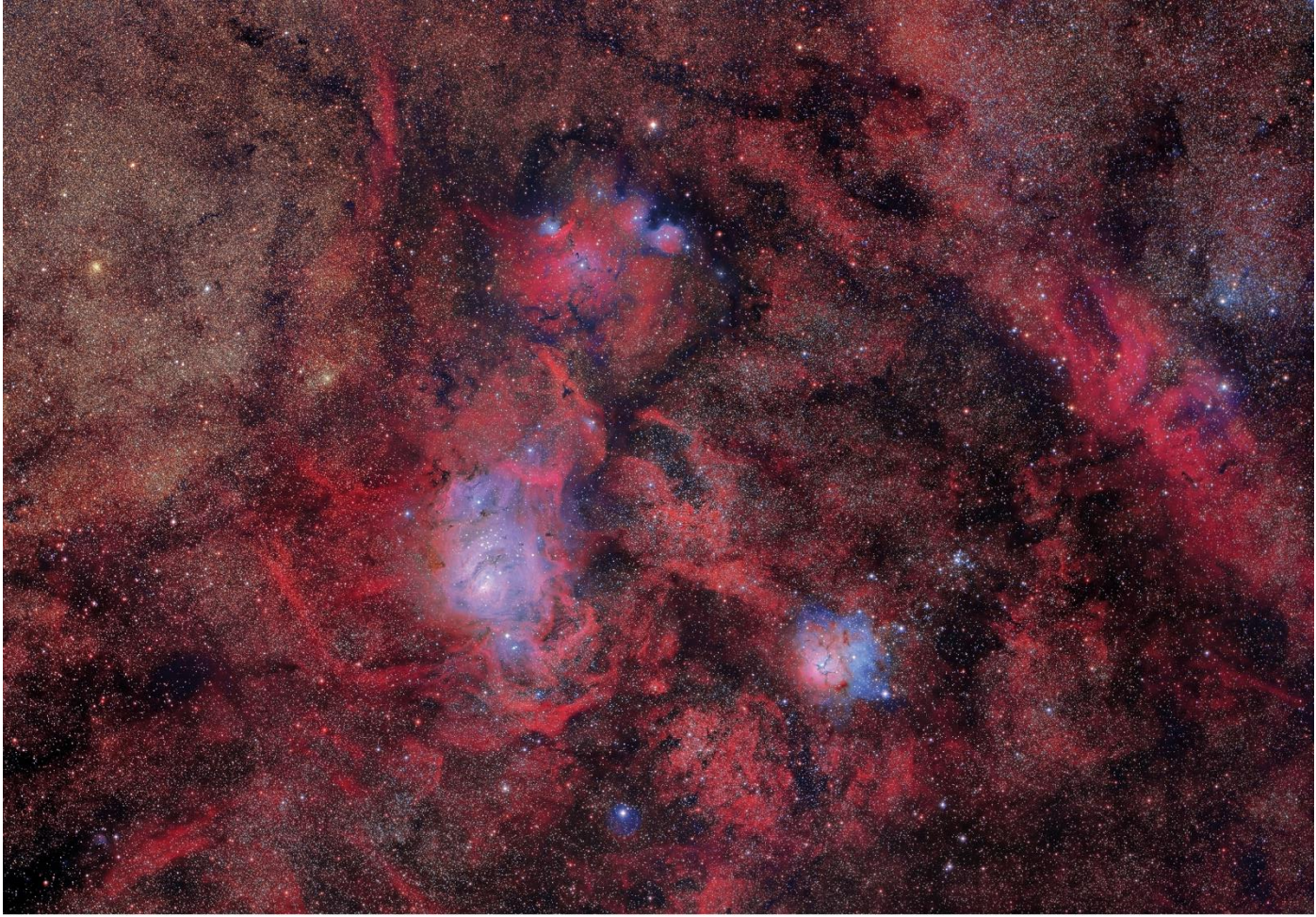
CUNAS ESTELARES. Regiones de formación estelar: nebulosas Laguna (M42), Trífida (M20) y NGC 6559.

Todas las estrellas, tanto las miles que podemos ver a simple vista como las decenas de miles de trillones que no, nacen gracias a procesos físicos naturales en el interior de inmensas nebulosas, compuestas fundamentalmente de hidrógeno y algo de helio, los elementos químicos más sencillos y abundantes en el Universo. En estas etapas iniciales, las estrellas recién nacidas iluminan la materia que las rodea. Las tres regiones de la imagen son gigantescas nubes de gas y polvo situadas a unos 5.000 años luz de distancia y donde se están formando estrellas.