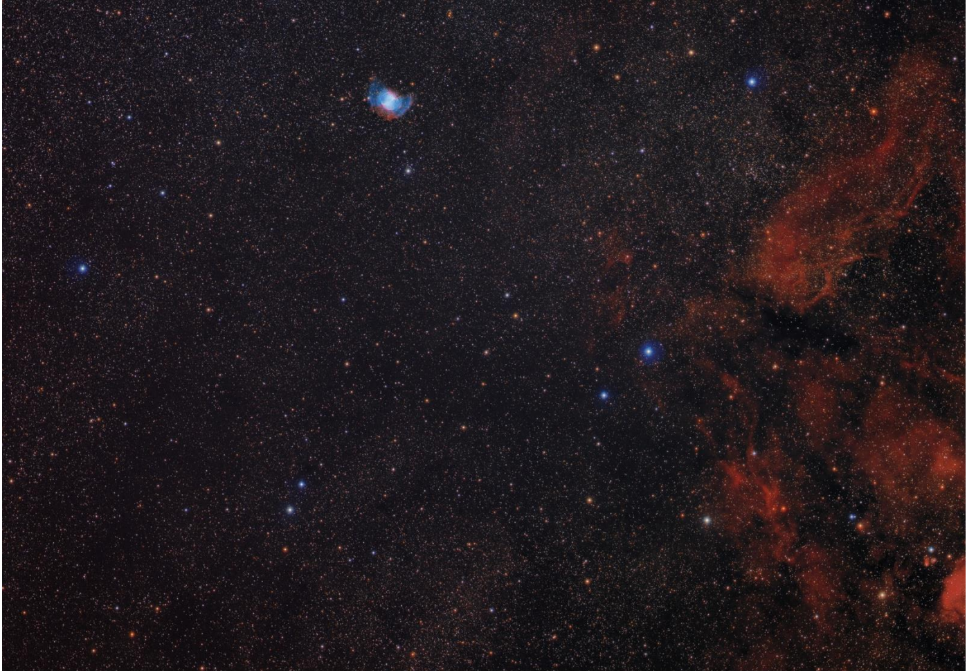
LÁPIDAS FUGACES. Nebulosa planetaria Dumbbell (M27, NGC 6853)

Casi todos los elementos químicos de los que estamos hechos se han generado en el interior de las estrellas. Cuando éstas tienen menos de 8 veces la masa del Sol, los elementos producidos en su interior a lo largo de sus vidas son esparcidos al medio interestelar al final de la misma en un proceso más o menos violento, formando las denominadas nebulosas planetarias. En el centro quedará una enana blanca, el núcleo extremadamente caliente de la estrella. Comenzará así un nuevo ciclo cósmico. Dumbbell, en la imagen, fue la primera en descubrirse, una de las mayores y más brillantes nebulosas planetarias conocidas.