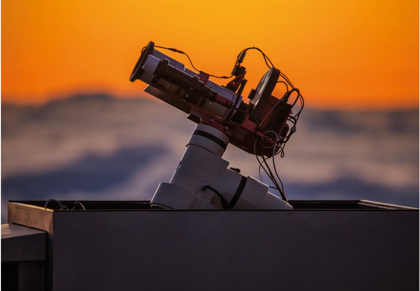
SKY TREASURE CHEST (STC). Un astrógrafo para la divulgación.

Para obtener las imágenes del proyecto "100 Lunas cuadradas", se instaló y se puso en marcha en 2017 en el Observatorio del Teide (Tenerife) un pequeño astrógrafo llamado Sky Treasure Chest (STC), de 380 mm de focal y 10 cm de apertura. Dotado de autoguiado y enfoque motorizado, su manejo es remoto y parcialmente robótico. El original diseño de su cúpula, con sistemas automatizados de detección de tiempo meteorológico adverso, otorga a este telescopio su nombre, ya que recuerda un cofre del tesoro.