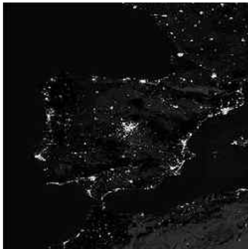
La península ibérica de noche. Son fácilmente distinguibles las principales ciudades.

El sobreconsumo , finalmente, es la consecuencia indeseada e inevitable de los factores anteriormente descritos. Si éstos se evitaran, ahorraríamos porcentajes mínimos de un 25% en la factura de la luz, pudiéndose alcanzar porcentajes mayores del 40% en ciertos casos, si existiera la voluntad de utilizar lámparas de sodio de baja presión y se hiciera una fuerte apuesta por rebajar potencias en las luminarias. Porque lo cierto es que hasta el presente ha existido una especie de contubernio entre las compañías eléctricas y los fabricantes de luminarias y de bombillas, por el cual unos y otros han hecho del exceso de consumo su principal negocio. Las eléctricas porque mayor consumo equivalía hasta ahora a tener un mayor beneficio y los fabricantes de bombillas y de luminarias porque cuanto mayor sea la potencia que se instale, tanto más se encarece el producto, reduciéndose, además, su vida útil. Por razones coyunturales, ahora el negocio parece desplazarse hacia la política de ahorro en el consumo, por lo cual, en principio, no existe aparente oposición por su parte a reducir la contaminación lumínica. Por otro lado, la exigencia de ofrecer al mercado nuevas luminarias no contaminantes y lámparas más eficientes, puede suponer, incluso un revulsivo para la competitividad del sector.