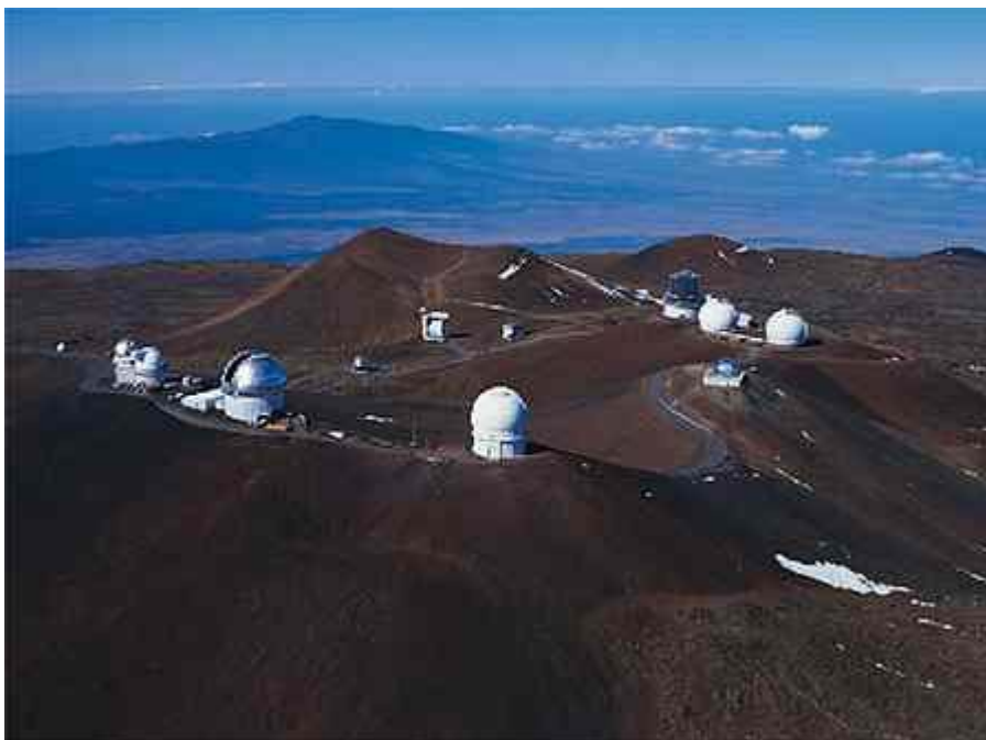
Complejo de observatorios astronómicos en Mauna Kea (Hawai).

A todo lo dicho hay que añadir que la contaminación lumínica, juntamente con la contaminación radioeléctrica y la del espacio, representa la más seria amenaza para el progreso de la astrofísica. La dispersión de la luz en la atmósfera convierte el fenómeno en algo capaz de alterar la calidad del cielo a grandes distancias, afectando así las zonas en las que se ubican los observatorios profesionales. Por esta razón, los primeros signos de denuncia del peligro que suponía la contaminación lumínica para la ciencia astronómica procedieron de los sectores astrofísicos y se canalizaron a través de la Unión Astronómica Internacional (IUA), cristalizando en una serie de convenios de protección de los observatorios, establecidos con la UNESCO, y en la redacción de recomendaciones de carácter luminotécnico para los distintos estados de la Tierra. Pero estas últimas no se han tenido en cuenta, en la práctica, con lo cual hoy día la situación es realmente angustiada y algunos observatorios, o bien han cerrado, o bien se mantienen realizando tareas de observación menores en comparación con las observaciones que se podrían realizar si el cielo nocturno no se hubiera deteriorado.