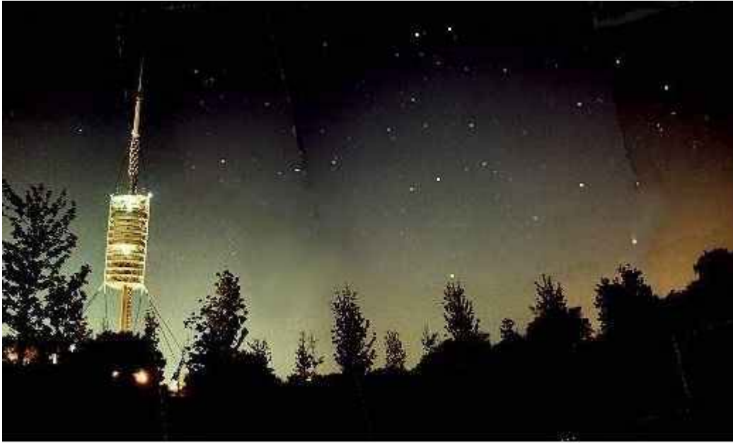
Parte del halo de luz de Barcelona, visto desde Collserola. Obsérvese la progresiva degradación del fondo del cielo.

La destrucción del paisaje celeste comporta, a mi entender, profundas consecuencias culturales y humanas. Si el desplazamiento masivo de la población desde áreas rurales a las urbanas ya implica de por sí una pérdida inevitable de las formas de vida tradicionales y de los elementos culturales en que éstas se basan, la imposibilidad de contemplar el cielo desde las ciudades priva además al individuo de un contacto directo con el universo, lo que origina un inevitable empobrecimiento cultural y personal. En las sociedades industriales, donde el volumen de información acerca del cosmos que está a disposición de cualquiera es enorme, se da la circunstancia paradójica de que los individuos sufren un desconocimiento mayor de las cosas del universo, si comparamos esta situación con la que se encuentran, en general, los habitantes de zonas rurales, menos evolucionadas, que pueden saber menos sobre los astros, pero que los sienten como algo infinitamente más cercano.