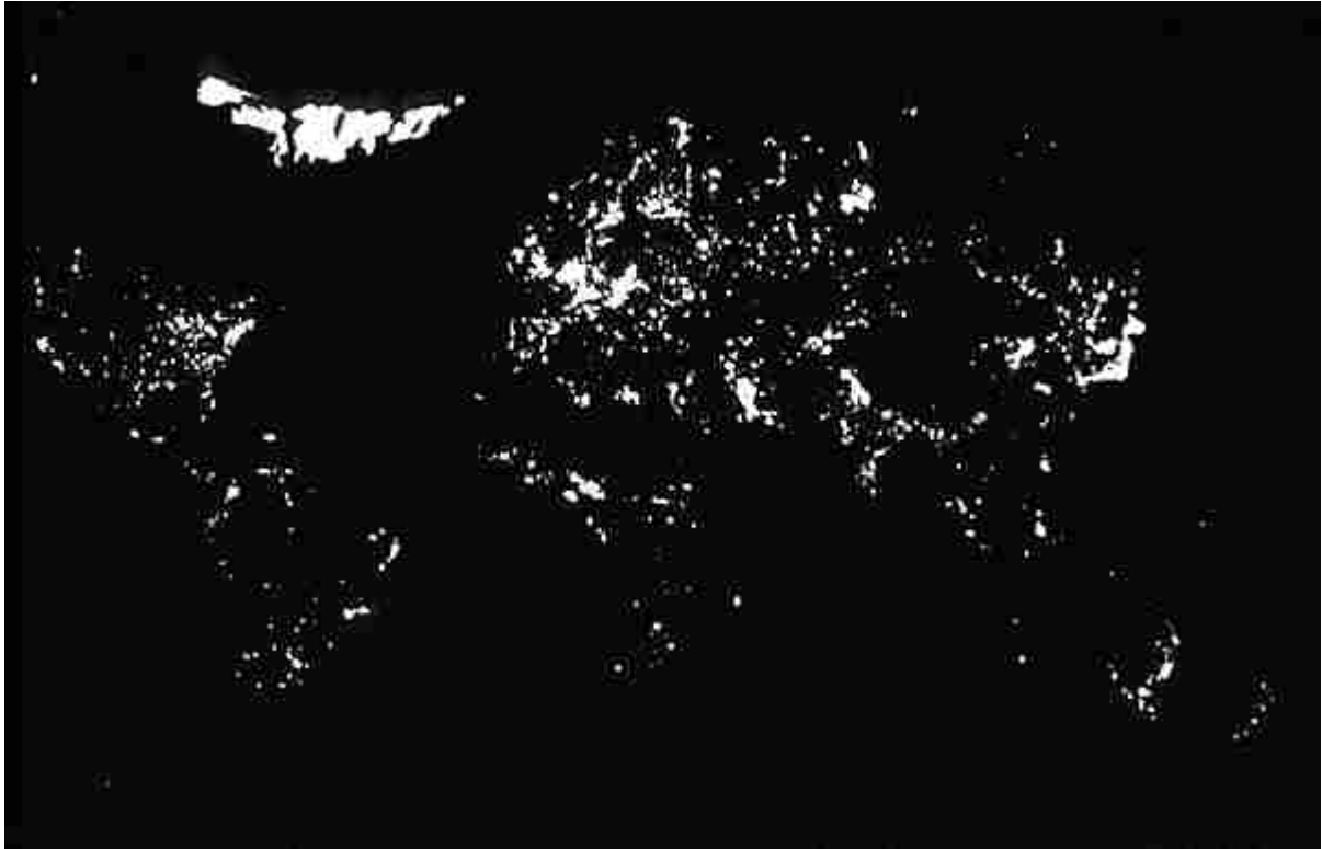
La Tierra de noche, vista desde el satélite. No es sólo un mapa de las zonas habitadas, sino también de la riqueza. El brillo de la zona superior es una aurora boreal.