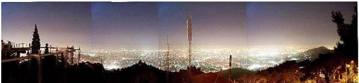
Panorama general de Barcelona. La difusión de la luz en el cielo destruye su oscuridad natural.

La dispersión hacia el cielo se origina por el hecho de que la luz interactúa con las partículas del aire, desviándose en todas direcciones. El proceso se hace más intenso si existen partículas contaminantes en la atmósfera (humos, partículas sólidas) o, simplemente, humedad ambiental. La expresión más evidente de esto es el característico halo luminoso que recubre las ciudades, visible a centenares de kilómetros según los casos, y las nubes refulgentes como fluorescentes. Como detalle anecdótico e ilustrativo se puede mencionar el hecho de que el halo de Madrid se eleva 20 Km. por encima de la ciudad y el de Barcelona es perceptible a 300 Km de distancia, desde el Pic du Midi y las sierras de Mallorca. En condiciones normales, los navegantes podrían ir de Mallorca a Barcelona de noche, simplemente guiándose por el resplandor del halo.